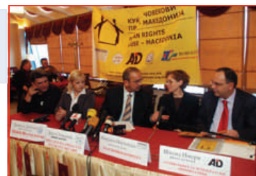
Прес конференцијата во хотел StoneBridge