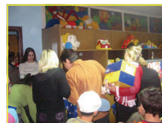
Предавањето на обувките на децата од домовите и семејствата од Арачиново

беа сместени во прифатилиштето на Амбасадата Меѓаши. Освен обувки, донираме и помошни медицински помагала од производната програма Dr.School на Клиниката за хирургија во Скопје. Обувките и помошните средства се производи на реномираната фирма SSI , а вкупната вредност на донацијата изнесуваше 2.370.000,00 денари.