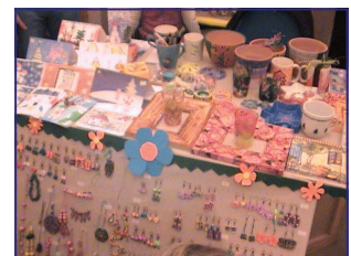
Саем на ракотворби Чифте Амам

амбасада Меѓаши кои со својата креативност и инспирирачки дух изработија прекрасни предмети, кои беа изложени на саемот на ракотворби во Чифте Амам, на Регионалниот НВО саем во Струмица, НВО саем во Гостивар, базарот организиран од Интернационалното здружение на жени и на Новогодишниот маркет на Скопски саем.