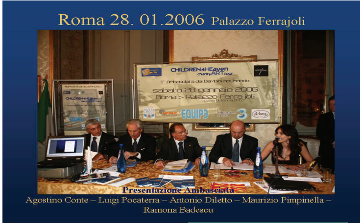
Roma 28. 01. 2006 Palazzo Ferrajoli

(Со важност до 21.12.2010.) почесен конзул во Наполи, Италија. Број на пасош 297