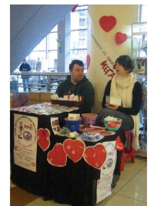
Изложбениот простор на Амбасадата во Рамстор

Огромна благодарност упатуваме до трговскиот центар Рамстор кој ја поддржа оваа акција, како и до фаст-фуд ресторанот Амаџи – Рамстор (3238-144) , кој обезбеди сендвичи за волонтерите на Меѓаши кои учествуваа во самата акција.